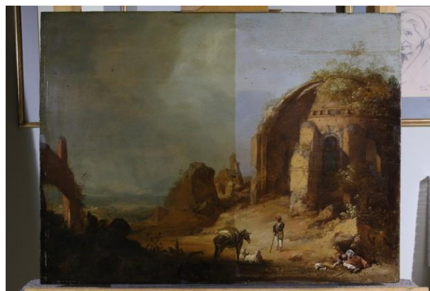
Foto van de restauratie van Breenberghs Tempel van Minerva Medica februari 2020

In 2020 werd het schilderij De Tempel van Minerva Medica gerestaureerd. Dit paneel uit ca. 1635, geschilderd door Bartholomeus Breenbergh, werd door restaurator Lara van Wassenaar in het begin van 2020 gerestaureerd. De oude vergeelde vernis is verwijderd, oude retouches zijn hersteld en lacunes opgevuld. De restauratie werd volledig bekostigd vanuit Het Breenbergh Fonds dat in 2018 werd opgericht.