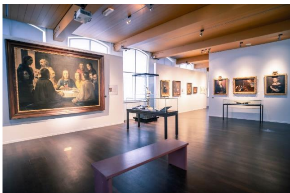
Impressie topstukkenzaal 1e etage Museum De Waag

De collectie van Museum De Waag bevat een rijk overzicht van objecten uit de lange stedelijke geschiedenis. Met deze meer vaste opstelling wil het museum die rijke collectie beter onder de aandacht brengen. Het museum krijgt zo (weer) meerdere vaste lagen en verhaallijnen, zodat een bezoeker altijd kennis kan maken met het ontstaan van Deventer, de ontwikkeling ten tijde van de Hanze, de markten, maar ook de ambachten (bijv. de koekbakkers en de zilversmeden) en opkomende (vroeg) industrie en stadsuitbreidingen.