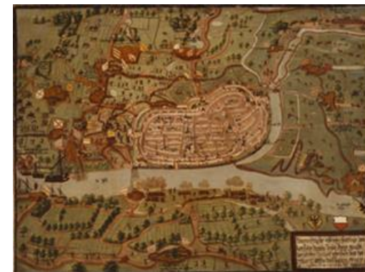
Schilderij van het beleg van Deventer door Rennenberg,

Geïnspireerd door de oproep van Vereniging Rembrandt om ten tijde van de coronacrisis tot hernieuwde aandacht voor kunstwerken uit de vaste museale collectie te komen, worden een aantal stukken uit de kerncollectie geëxposeerd in Museum de Waag onder de titel Waagstukken . Centraal staat het schilderij van het beleg van Deventer uit 1578 door de Staatse troepen onder leiding van Rennenberg.