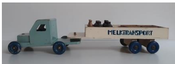
OKWA melktransportauto verworven in 2020

Voor de tentoonstelling Deventer Bezet & Bevrijd , zijn diverse partijen bereid gevonden om hun objecten uit te lenen waaronder het Ety Hillesum Centrum,