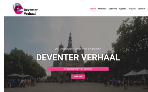
Homepage vernieuwde website Deventer Verhaal

Ook de website museumdewaag.nl is onder handen genomen en beter ingericht op zowel front- als backend-gebied. De ontwikkeling en live-gang van een nieuwe website voor Speelgoedmuseum Deventer is verschoven naar voorjaar 2021.