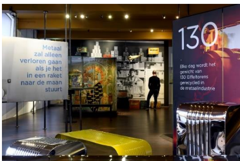
Impressie van de bliktentoonstelling in Museum De Waag

het menu. Hiervoor zijn tien afzonderlijke receptenkaarten ontwikkeld die bezoekers gratis mee konden nemen.