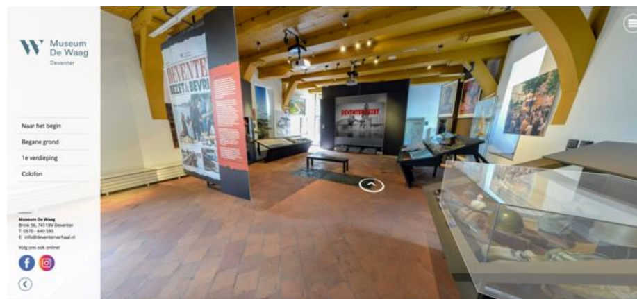
Beeld uit de VR-tour Deventer Bezet & Bevrijd op de website

Zo hebben we voor de tentoonstelling Deventer Bezet & Bevrijd een virtual reality tour ontwikkeld die maar liefst 19.712 keer is bekeken via www.museumdewaag.nl .