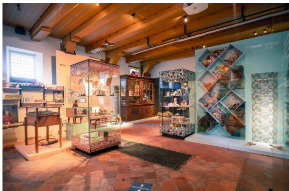
Speelgoed voor jong en oud, begane grond De Waag

In verband met de coronamaatregelen zijn de geplande opening, instap- en groeps rondleidingen komen te vervallen.