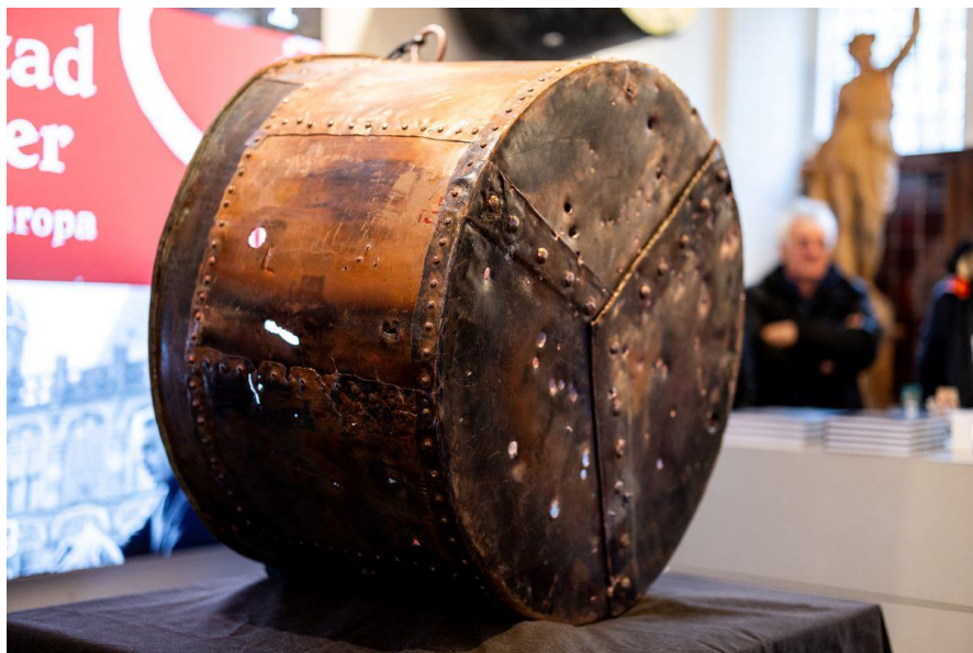
Replica van de valsemuntersketel

Naast buitenspelen is de winter natuurlijk ook de periode van binnenspelen. Mobaco, het Nederlandse constructiespeelgoed, werd met name rond de wintermaanden verkocht, tot in de jaren 50. Een groot kasteel, in bruikleen gegeven door een Mobaco verzamelaar, was het pronkstuk van dit onderwerp.