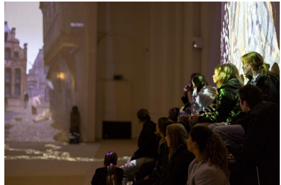
Schoolklas bij Expeditie Hanze

Met trots blikken we terug op een buitengewoon succesvol educatief programma-aanbod in Deventer. Maar liefst ruim 3.500 leerlingen en studenten, verspreid over 147 groepen, hebben we in het Speelgoedmuseum, Museum De Waag en de Oude Mariakerk mogen verwelkomen!