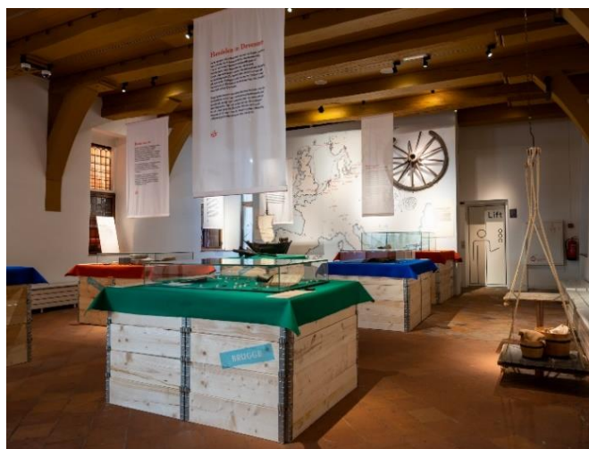
Hanzetentoonstelling Museum De Waag