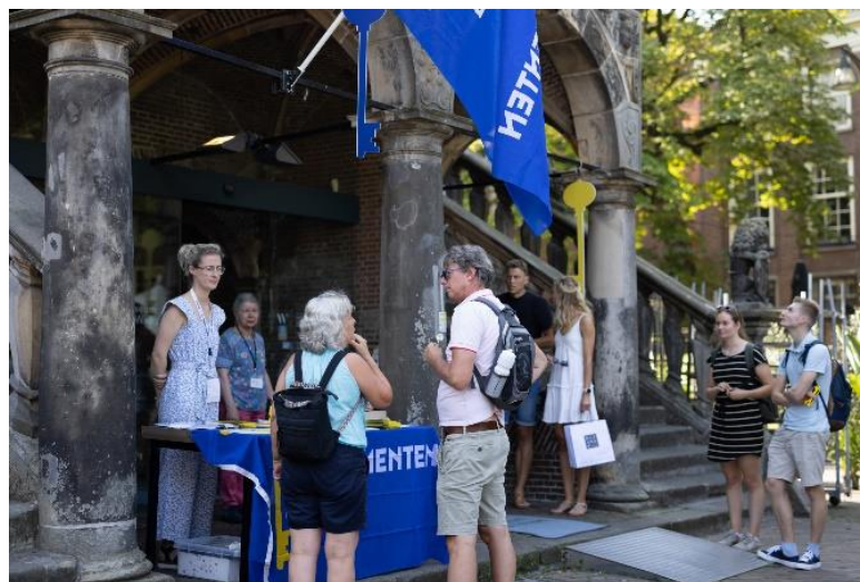
Vrijwilligers achter de infokraam tijdens Open Monumentendag Deventer

Deventer Verhaal volgt de Museum CAO. Zaken die niet in de CAO zijn geregeld, zijn vastgelegd in het personeelsreglement en/of het vrijwilligersbeleid.