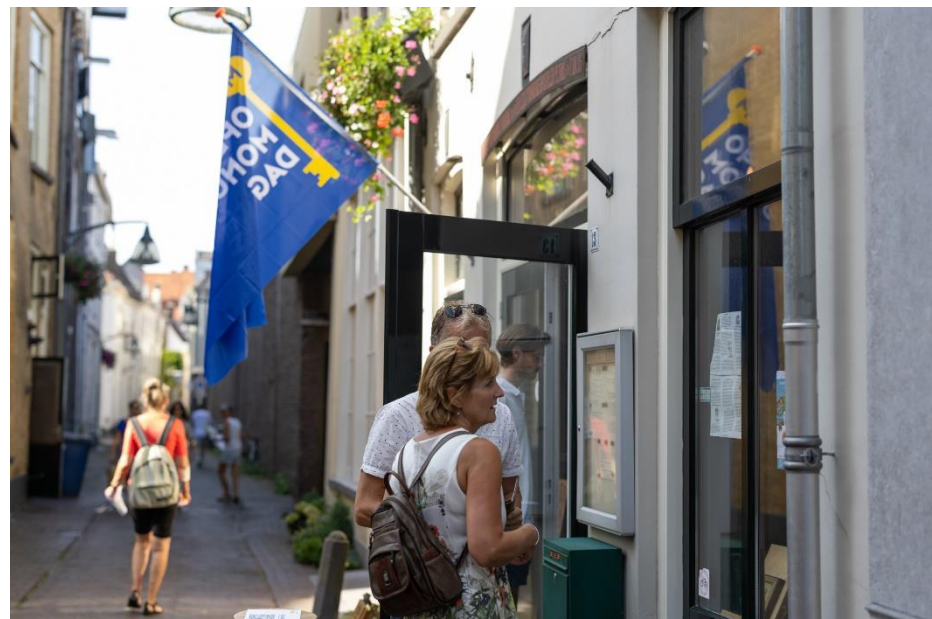
Open Monumentendag Deventer 2023

De voormalige gemeentemusea in Deventer zijn sinds het jaar 2001 geaccrediteerd bij het Nederlands Museumregister. Met de oprichting van de stichting Deventer Verhaal in 2014 is deze registratie van de gemeente overgegaan op de huidige stichting.