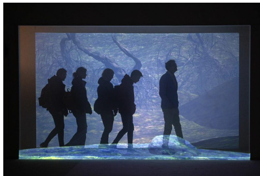
Hanze Experience in de Oude Mariakerk

Als klapstuk van het Hanzejaar presenteerde Deventer Verhaal begin december een replica van de beroemde valsemuntersketel uit 1434. Hierin is de muntmeester van Batenburg terechtgesteld voor het vervalsen van geld. Het koperlagersgilde uit Den Bosch maakte met veel toewijding de originele