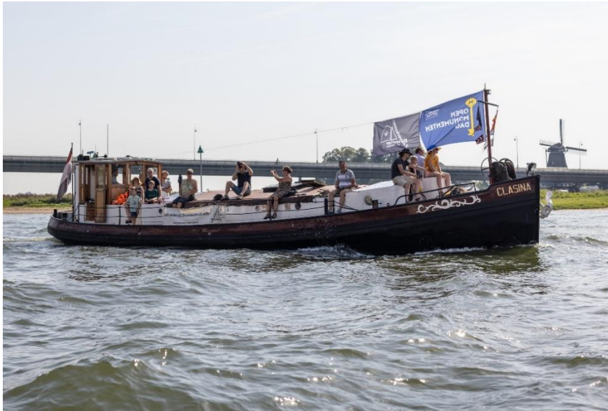
Klassieke schepen op de IJssel tijdens Open Monumentendag Deventer