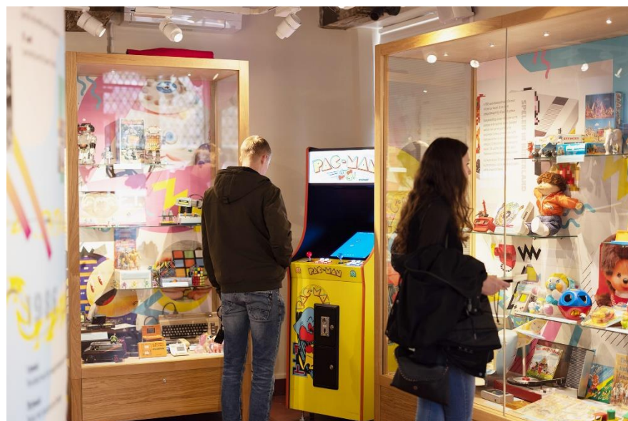
Spelen in de jaren '80 in het Speelgoedmuseum

De tentoonstelling Spelen in de jaren '80 was de eerste in een reeks tentoonstellingen over specifieke decennia, gericht op de belangrijkste gebeurtenissen uit de jaren '80 en specifiek gericht op de jeugdijaren en het speelgoed in dit kleurrijke decennium. Het uitgangspunt was om de aandacht te verleggen van vaak klassiek speelgoed naar speelgoed uit de jeugdijaren van veel ouders van vandaag de dag. Het gevoel van nostalgie werd afgewisseld met interessante wetenswaardigheden en soms onbekende verbanden tussen spel en gebeurtenissen.