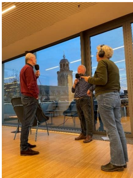
#DeventerVerhalen vrijwilligers in actie

De historische speurtocht Deventer (voorheen opa-en-oma-dag ) vond plaats op zondag 25 juni 2023, de dag waarop de bijzondere band tussen (groot) ouders en (klein)kinderen centraal staat door middel van een speurtocht naar het verleden in de binnenstad van Deventer. Op deze zeer zonnige dag stond het Noordenbergkwartier centraal. Startpunt was de Fermerie, eindpunt was SIED aan het Klooster. Er waren 81 deelnemers waarvan 43 kinderen.