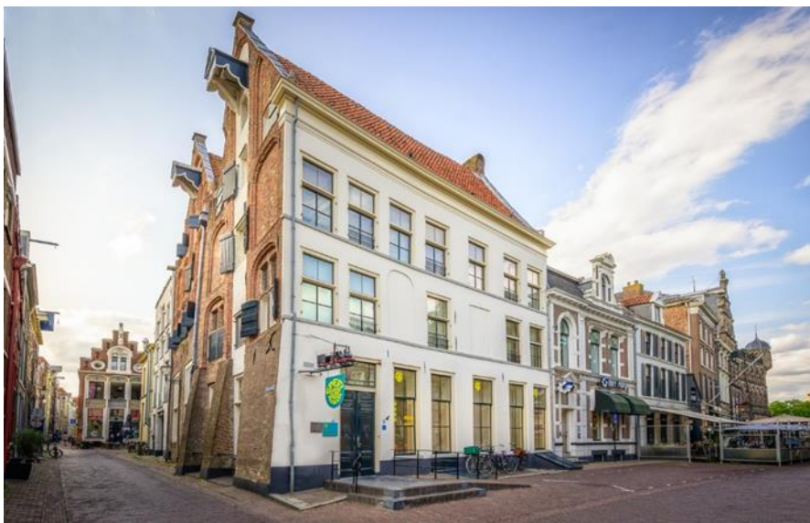
Speelgoedmuseum Deventer

Inclusief de bezoekers aan de Hanze Experience hebben we in totaal 119.382 geregistreerde bezoekers getrokken. In totaliteit hebben we met onze activiteiten 140.000 bezoekers actief bij het erfgoed van Deventer betrokken. Al met al een topjaar!